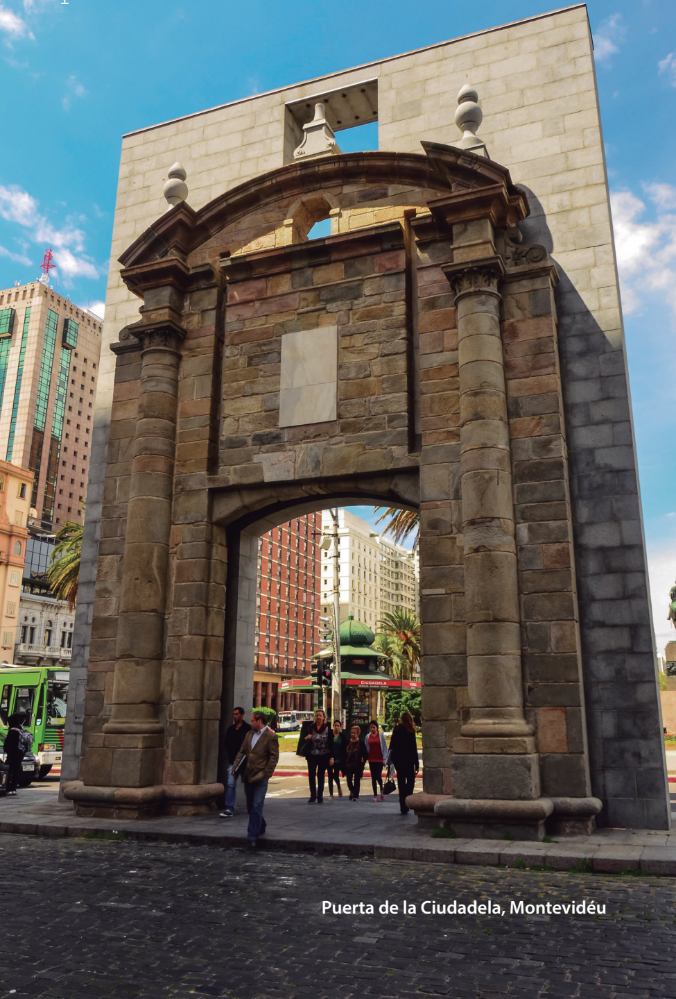
Puerta de la Ciudadela, Montevideu