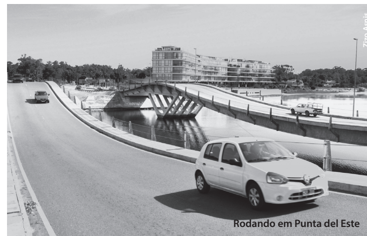
Rodando em Punta del Este

Partindo da fronteira brasileira, se o destino for Montevideú, chega-se facilmente viajando ao longo do dia, com direito a paradas em vários locais interessantes. O caminho mais habitual é pelo litoral ( Rutas 9 e 10 ) mas pode-se viajar pelo centro do país ( Ruta 8 , via Melo e Minas; ou Ruta 5 , via Rivera e Tacuarembó) ou pelo Oeste, região das Termas ( Ruta 3 , via Salto e Paysandú). Veja o capítulo final – “Viajando de carro desde o Brasil”, a partir da p.363, para informações mais detalhadas dos trajetos que podem ser percorridos para chegar em Montevideú desde o Brasil.