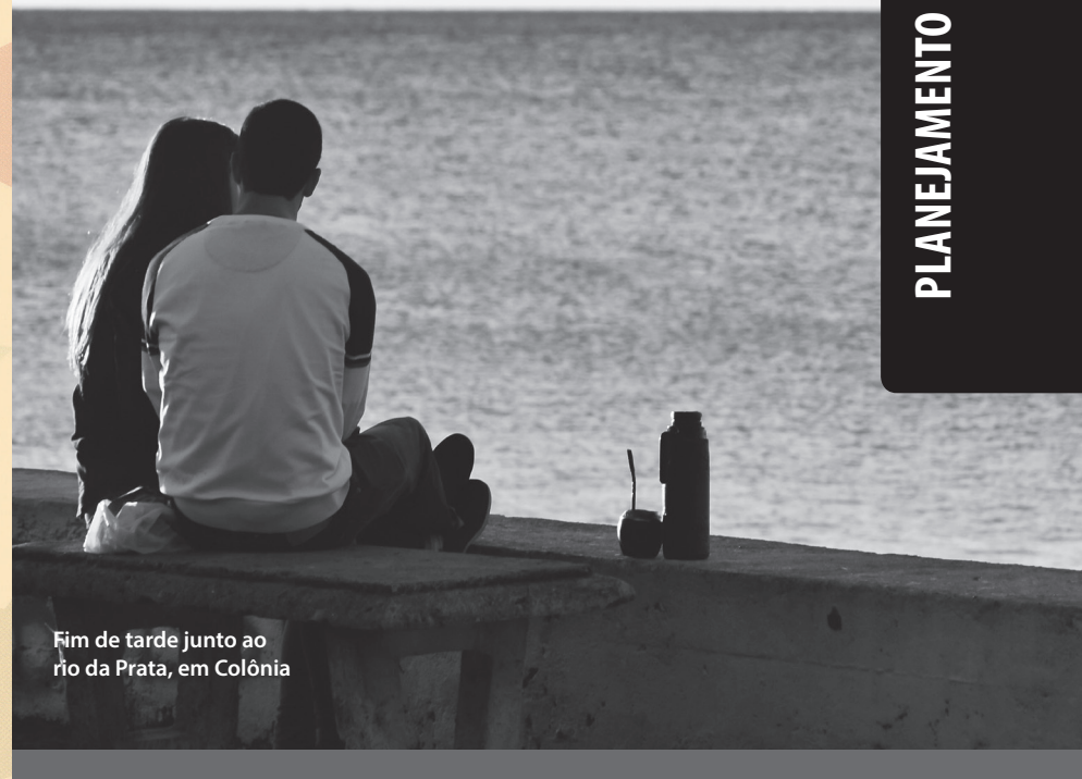
Fim de tarde junto ao rio da Prata, em Colônia